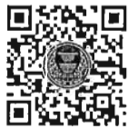
หนังสือนัดประชุม และระเบียบวาระการประชุม สภาผู้แทนราษฎร

การนัดประชุมได้แจ้งให้สมาชิกทราบทางสื่ออิเล็กทรอนิกส์เรียบร้อยแล้ว และท่านสมาชิกสามารถ อ่านเอกสารประกอบการประชุมสภาผู้แทนราษฎรได้ โดยการสแกน QR Code หรือทาง www.parliament.go.th