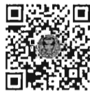
กระทู้ถามสด ด้วยวาจา